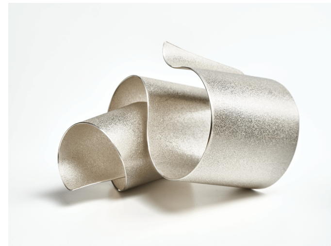
Üte Decker Bague sculpture argent recyclé

Les bijoux peuvent jouer un rôle clé dans les débats et les défis sociaux contemporains. "Les bijoux ne sont jamais uniquement des bijoux; si nous regardons plus profondément, ils ont de riches histoires à raconter."