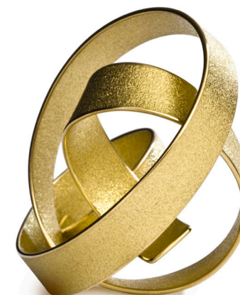
Üte Decker Bague sculpture 18 CT or du commerce équitable