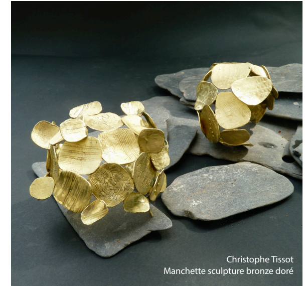
Christophe Tissot Manchette sculpture bronze doré

Né en 1960 à Créteil, Christophe Tissot est un artiste à l'œuvre protéiforme, il s'exprime à grande échelle dans le champ pictural mais aussi dans les arts appliqués tels que la peinture murale, la tapisserie contemporaine et le bijou d'artiste.