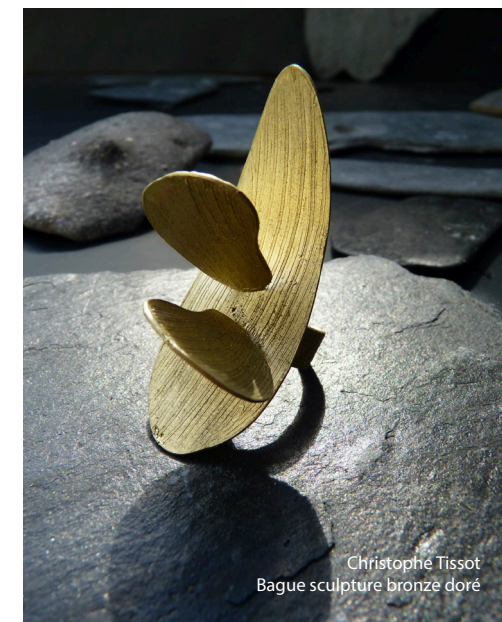
Christophe Tissot Bague sculpture bronze doré

Ses interventions dans l'espace public nous invitent à nous interroger sur les événements de la vie, sur le cycle du temps et sur l'harmonie de l'homme avec son environnement naturel et culturel.