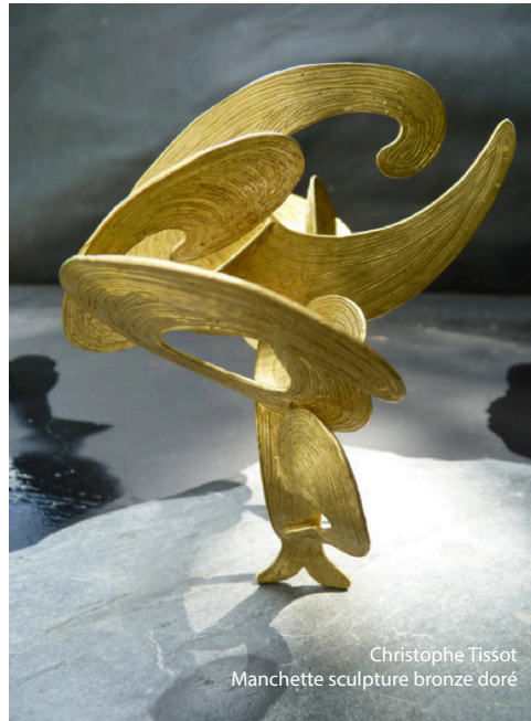
Christophe Tissot Manchette sculpture bronze doré